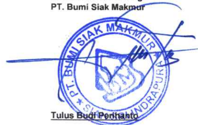
Tulus Budi Perhatto