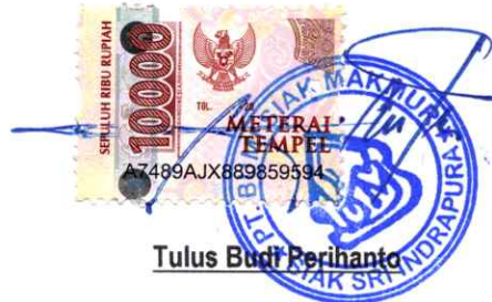
Tulus Budi Perihanto